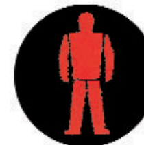
Germania Ovest/ BRD