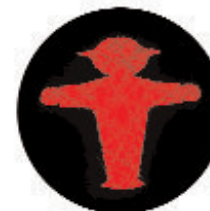
Germania Est/ DDR